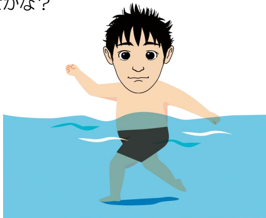
《先月の答え: 56 (8×7)》

高原くんがお腹がペコペコだったのに水中に入ったら食欲がなくなっちゃたよ。なぜかな?