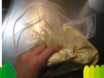
ジップロックに入れて 混ぜる