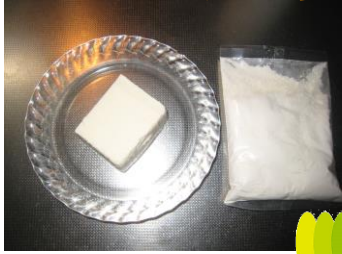
ホットケーキミックスと 豆腐を用意