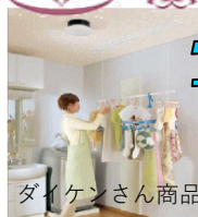
ダイケンさん商品