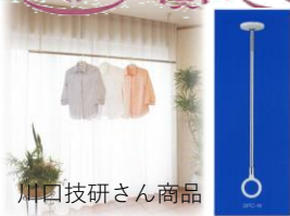
川口技研さん商品