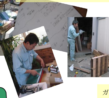
ガーデニングテーブルとチェア