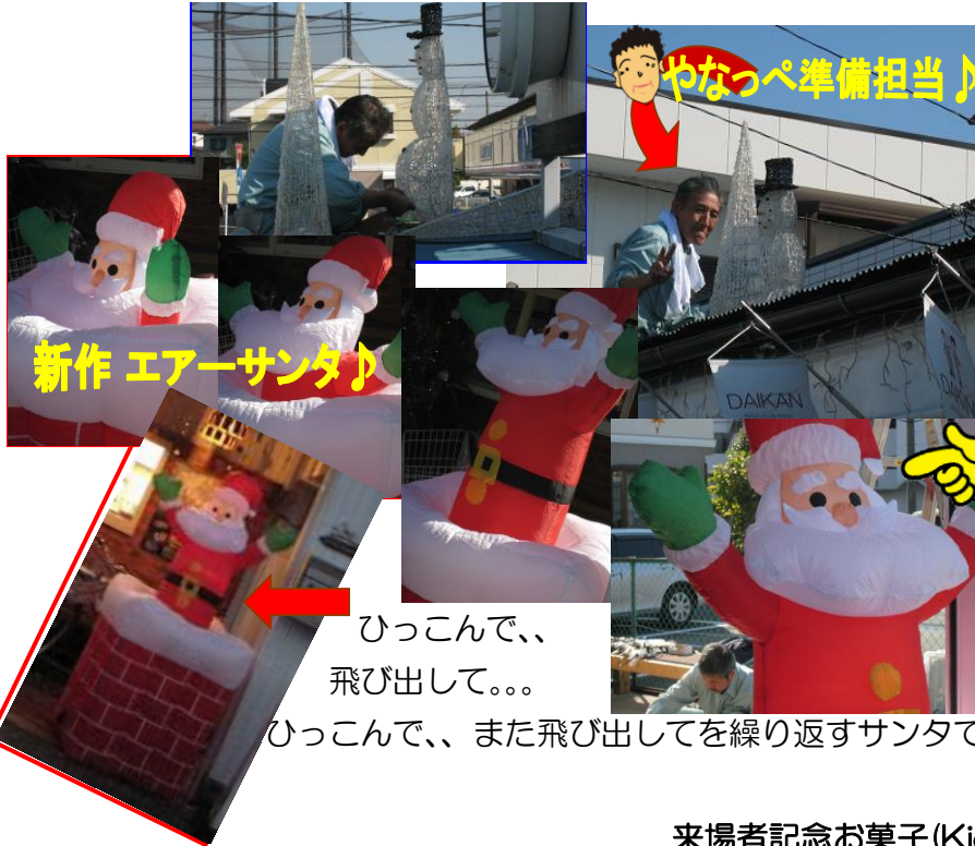
新作 エアースンタ♪

そして無事に点灯★ 今年の新作はエアースンタです！ ちょっと風に弱そうですけどね。。