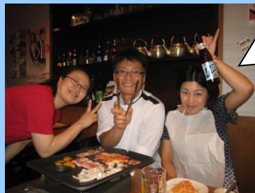
こんなに仲良くなっちゃいました 初めてなのに