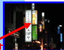
タイ料理屋さんの2階です