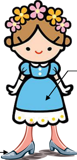
パニエ入りスカート

また、何故、トイレにはOタイプとUタイプの便座がありますが、これは男の人のために考えられているとか。女性にはわからないことですが、Oタイプだと男の人の下腹部が便座にあたる衛生上の問題から2種類考えられたそうです。今は暖房便座の復旧によりOタイプが主流になっています。そして、暖房便座だからこそ熱の損失を防ぐ為に便座の蓋は必要不可欠ですが、この蓋は匂いなどを防ぐ為の‘オマル’から始まっていますので、昔から蓋は付いていますが日本では暖房便座以外に必要なないといったら必要ないかも知れません。しかし、欧米では洗面台とシャワー・トイレが一緒になっていてこの時、トイレの蓋が椅子代わりに使っていたりするようです。日本では抵抗がありますが、国によって違いがあるようですね。